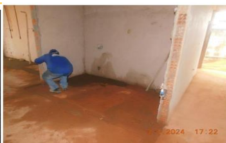
Execução de contrapiso na área de reforma