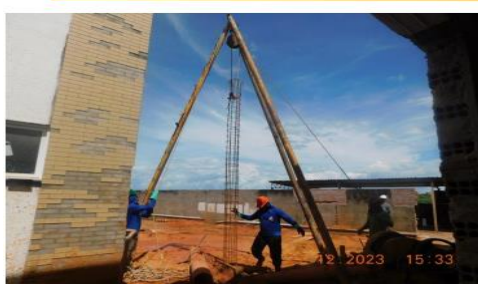
Execução de estaca Strauss na ampliação da enfermagem